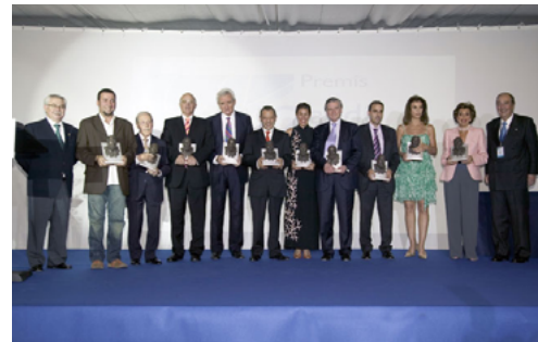
I Gaudí Gresol 2007