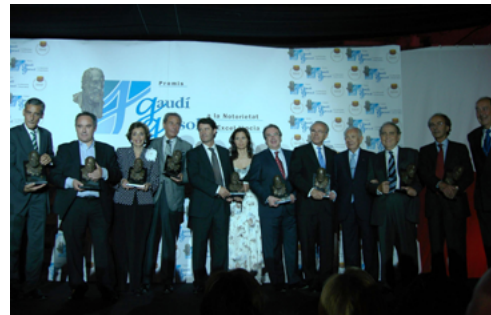
II Gaudí Gresol 2008