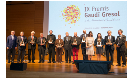
IX Gaudí Gresol 2015