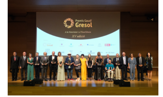
XV Gaudí Gresol 2022