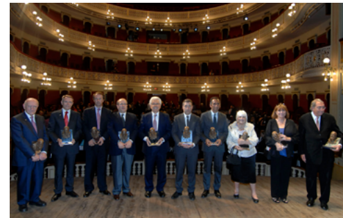
VI Gaudí Gresol 2012