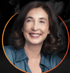
Elsa Punset Comunicació