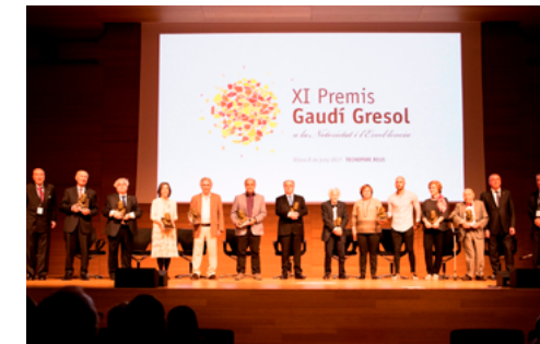
XI Gaudí Gresol 2017