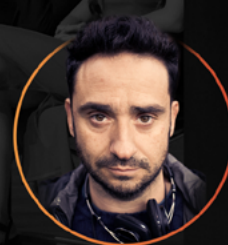
Juan Antonio Bayona Cinema