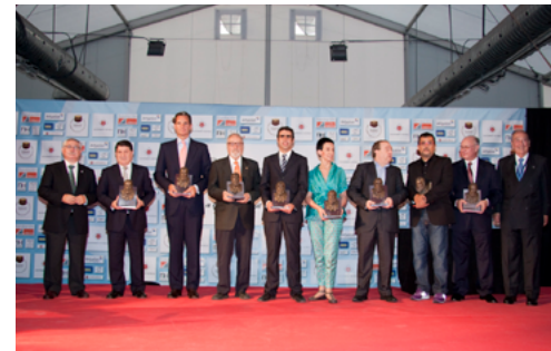
III Gaudí Gresol 2009