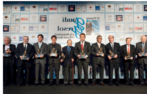
IV Gaudí Gresol 2010