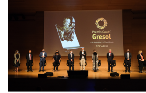
XIV Gaudí Gresol 2021