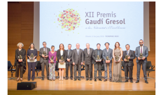
XII Gaudí Gresol 2018