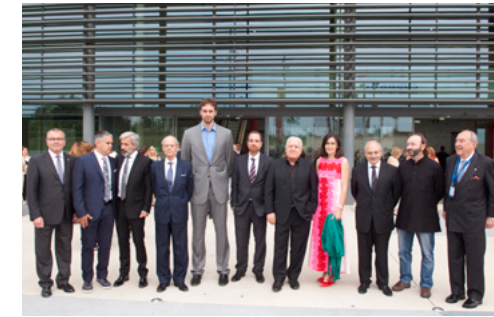
VIII Gaudí Gresol 2014