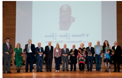
V Gaudí Gresol 2011