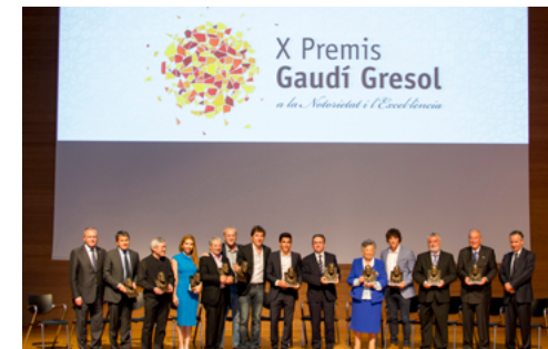
X Gaudí Gresol 2016