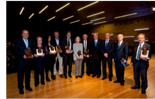
VII Gaudí Gresol 2013