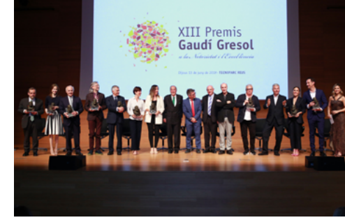
XIII Gaudí Gresol 2019